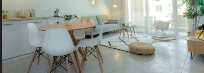
Appartement décoré de la résidence Symbiose - Carros

La maîtrise de l'ensemble de nos métiers et notre capacité d'innovation permanente nous permettent de répondre à vos attentes, en vous apportant des solutions sur-mesure qui anticipent les futures mutations des modes de vie.