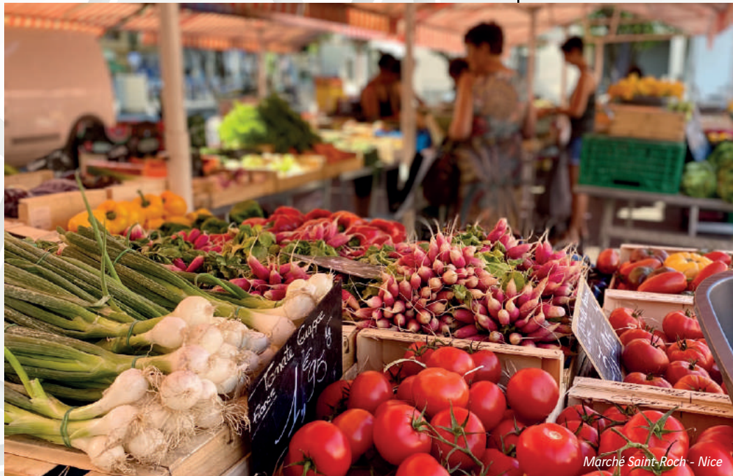
Marché Saint-Roch - Nice

“ Un quartier ouvert sur la ville, à deux pas des collines et de la Méditerranée. ”