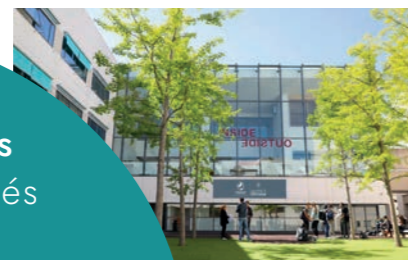
Campus Saint-Jean d'Angély