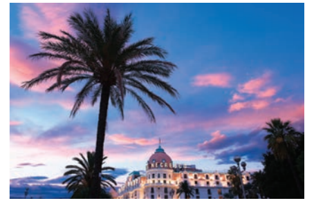
Hôtel Le Negresco