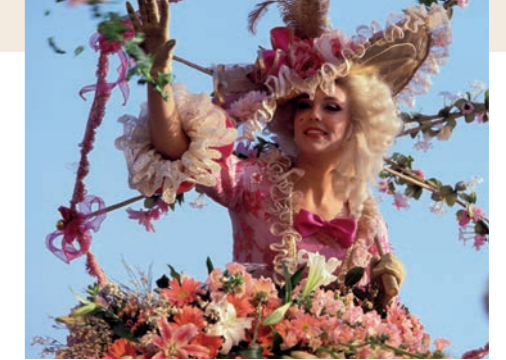
Le carnaval de Nice