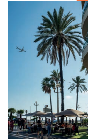
Promenade des Anglais

9 campus à Nice dont le Campus Saint-Jean d'Angély