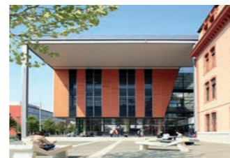
Bibliothèque Saint-Jean d'Angély