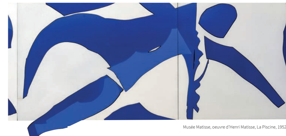
Musée Matisse, oeuvre d'Henri Matisse, La Piscine, 1952

En dehors des heures de cours, la vie niçoise bat son plein ! Les étudiants peuvent profiter d'une vie culturelle foisonnante , rythmée par de nombreux rendez-vous tels que le carnaval, la foire de Nice ou encore la fête du Port... La métropole a également mis en place plusieurs dispositifs destinés à faciliter l'accès à la culture, comme le Pass Musées qui donne un accès gratuit à tous les musées et galeries municipaux.