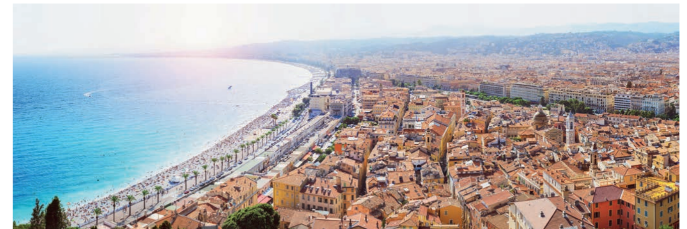
Vue de Nice

Aux carrefours des échanges culturels et commerciaux, Nice offre de nombreuses opportunités qui attirent les talents du monde entier.