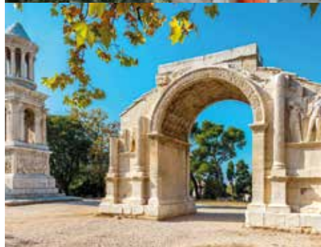
Les Antiques, sur le site archéologique de Glanum