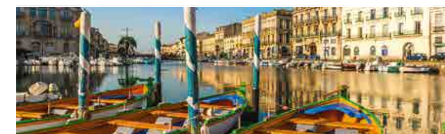
Le Canal Royal à Sète