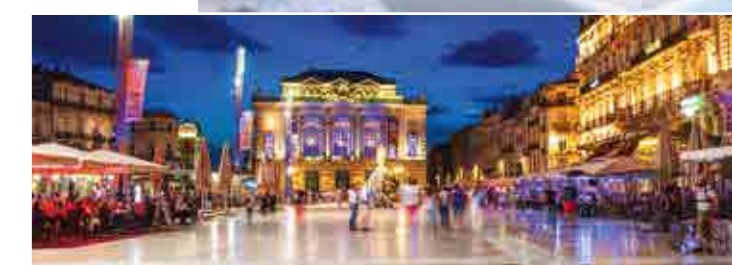
La Place de la Comédie à Montpellier