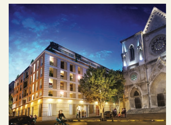
Marseille 5 ème L'ARCHANGE