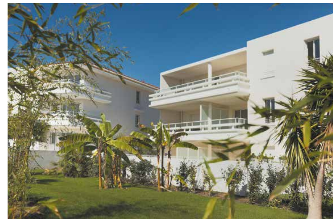
Royal Rivage - Carqueiranne (83)