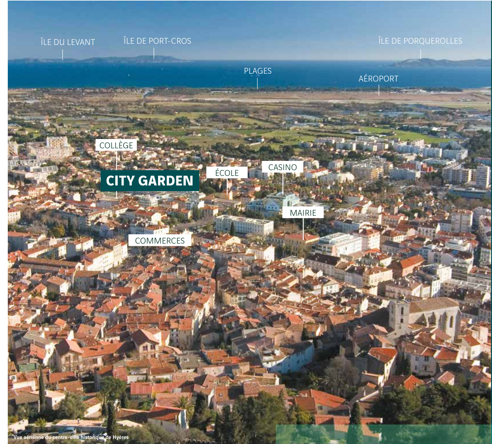
Vue aérienne du centre-ville historique de Hyères