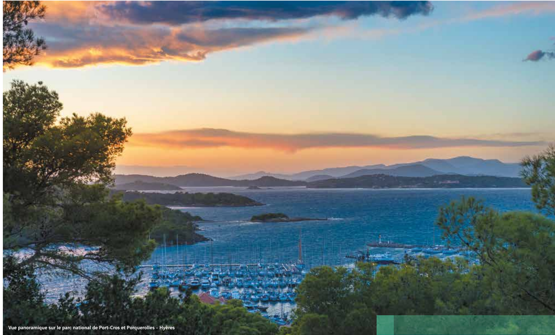
Vue panoramique sur le parc national de Port-Cros et Porquerolles - Hyères