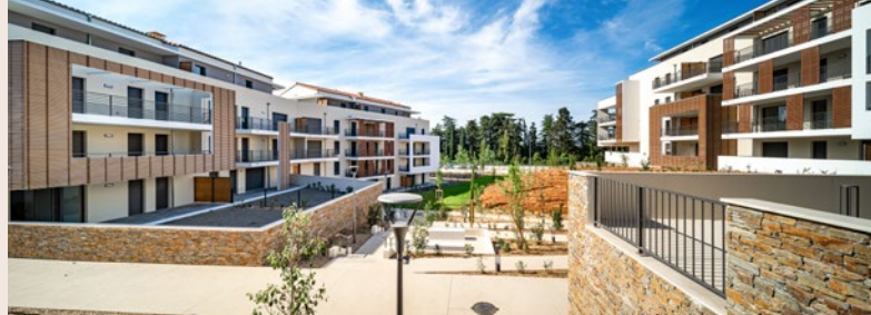
Résidence Boréal - Aix-en-Provence (13)

La maîtrise de l'ensemble de nos métiers et notre capacité d'innovation permanente nous permettent de répondre à vos attentes, en vous apportant des solutions sur-mesure qui anticipent les futures mutations des modes de vie.