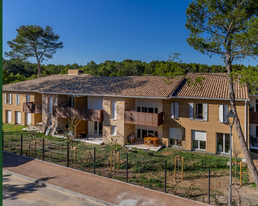
Résidence Nuances de Provence - Peynier (13)