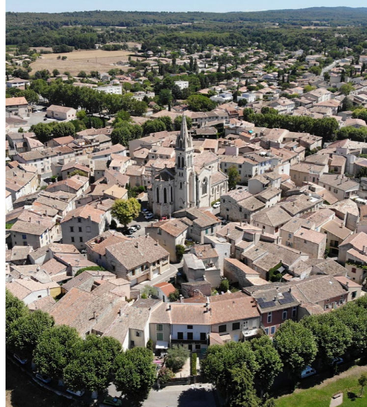
Centre-ville de Saint-Cannat