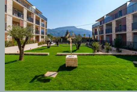
Déploiement Œuvre réalisée par LUTFI ROMHEIN