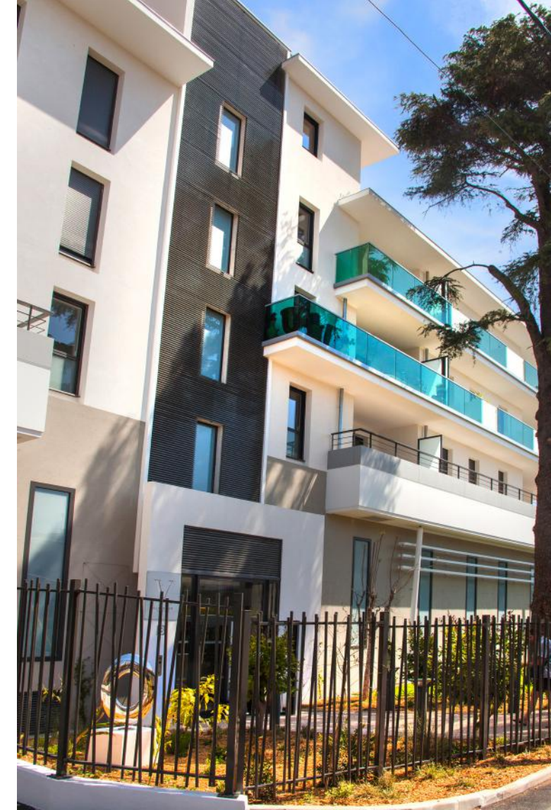
Résidence Villa Vespins à Cagnes-sur-Mer (06)

(2) Votre logement est certifié NF Habitat HQE, attestant ainsi qu'il répond à des critères de qualité et de performance supérieures pour un habitat durable, contrôlés par un organisme indépendant selon un référentiel exigeant. C'est pour vous, des bénéfices concrets au quotidien en termes de qualité de vie et de confort, de respect de l'environnement et de maîtrise des dépenses. Le choix de cette certification traduit notre engagement dans la qualité de la conception et de la construction de votre logement, de sa performance et du service délivré à l'occupant.