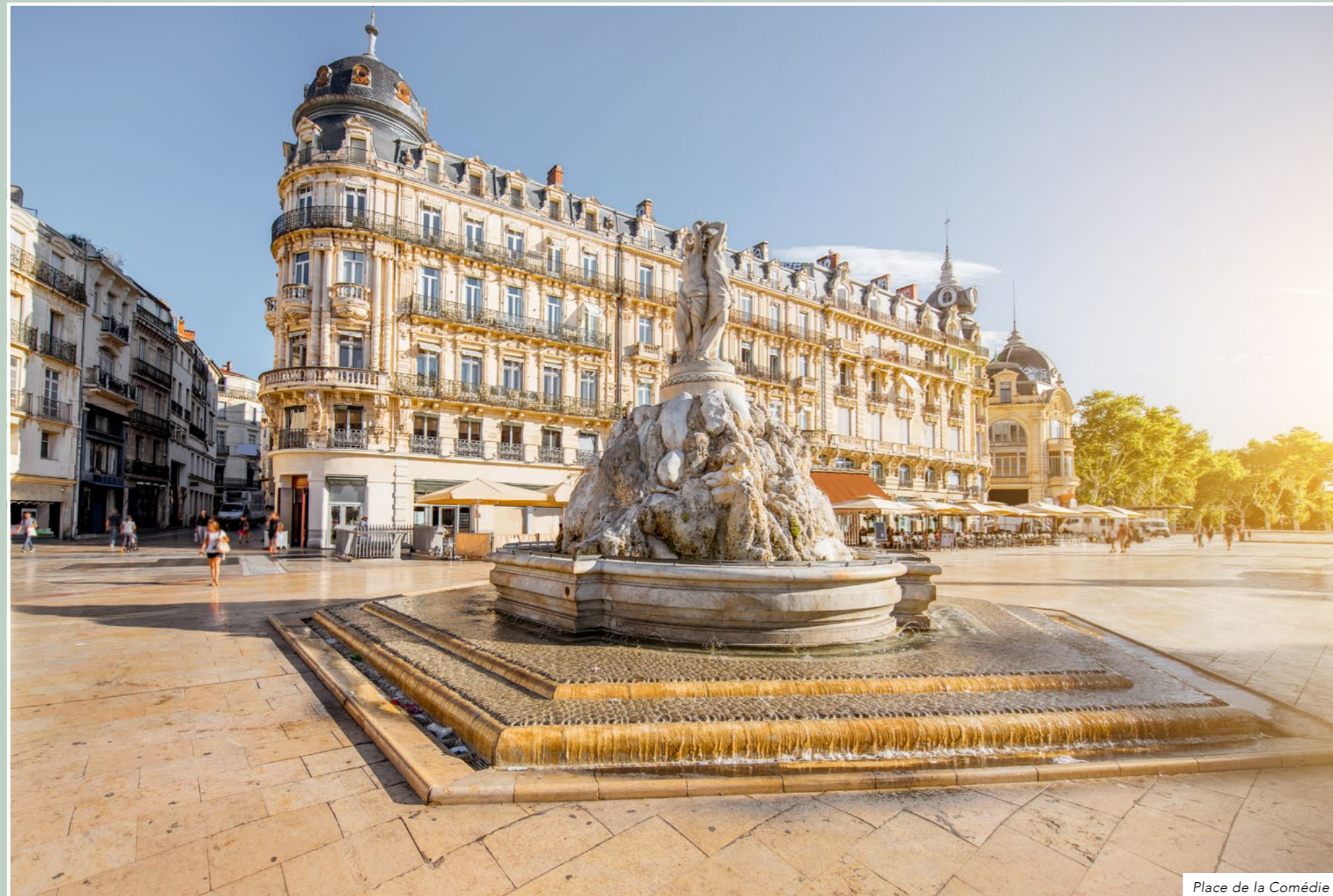
Place de la Comédie