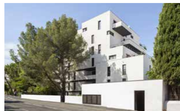
La Canopée - Montpellier Architecte : Samantha Dugay