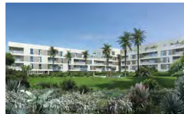
Le Jardin de Matisse Architecte : Es-Pace