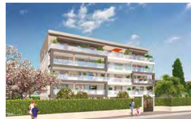
12 Scudéri Architecte : SPAGNOLO - A2S