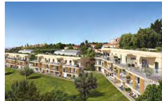
Les Terrasses Architecte : DP ARCHITECTURE