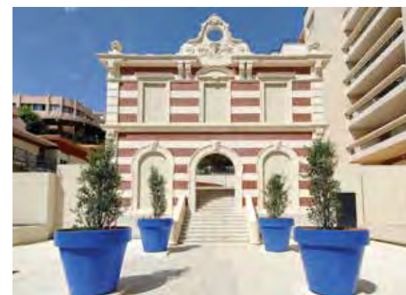
154 rue Breteuil - Marseille 6 e