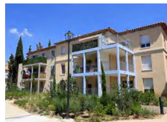
Le Domaine des Cyprès - Allauch Les Tourres