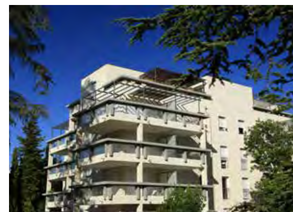
Le Domaine des Grands Cèdres - Marseille 10 e