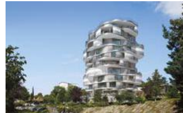
Folie Divine - Montpellier Architecte : Farshid Moussavi