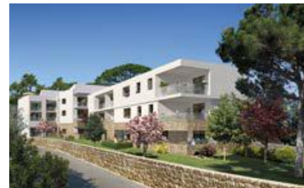
Cœur Castelnau - Castelnau-le-Lez Architecte : EXO 7