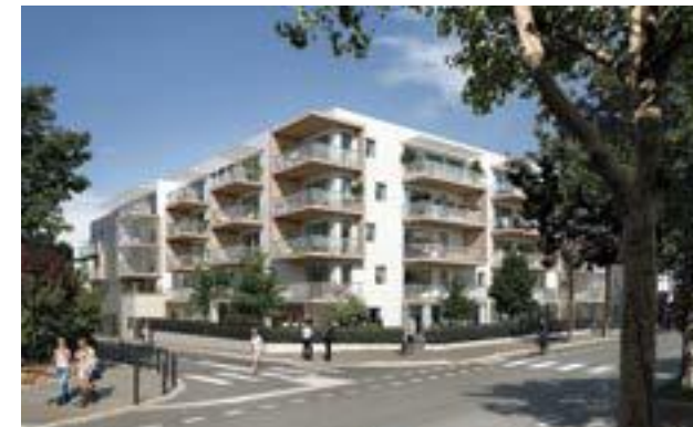
Le Jardin des Beaux Arts - Montpellier Architecte : Antoine Soler