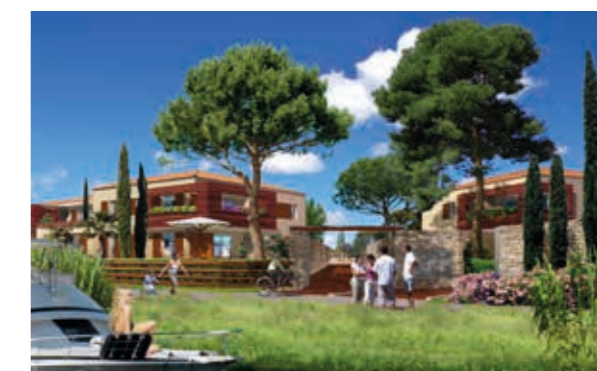
Mas de Constance - Aigues Mortes Architecte : Antoine Soler