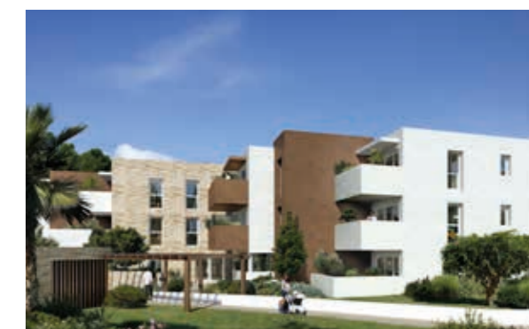
Villa des Grèzes - Montpellier Architecte : Imagine Architectes