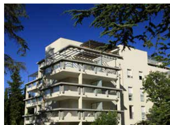
Le Domaine des Grands Cèdres - Marseille 10 e