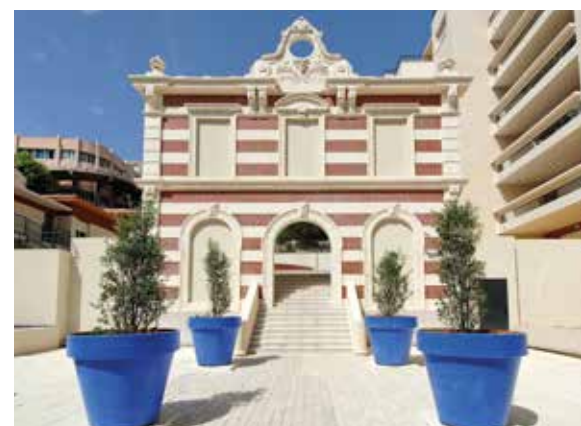
154 rue Breteuil - Marseille 6 e