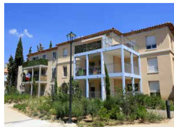
Le Domaine des Cyprès - Allauch Les Tourres