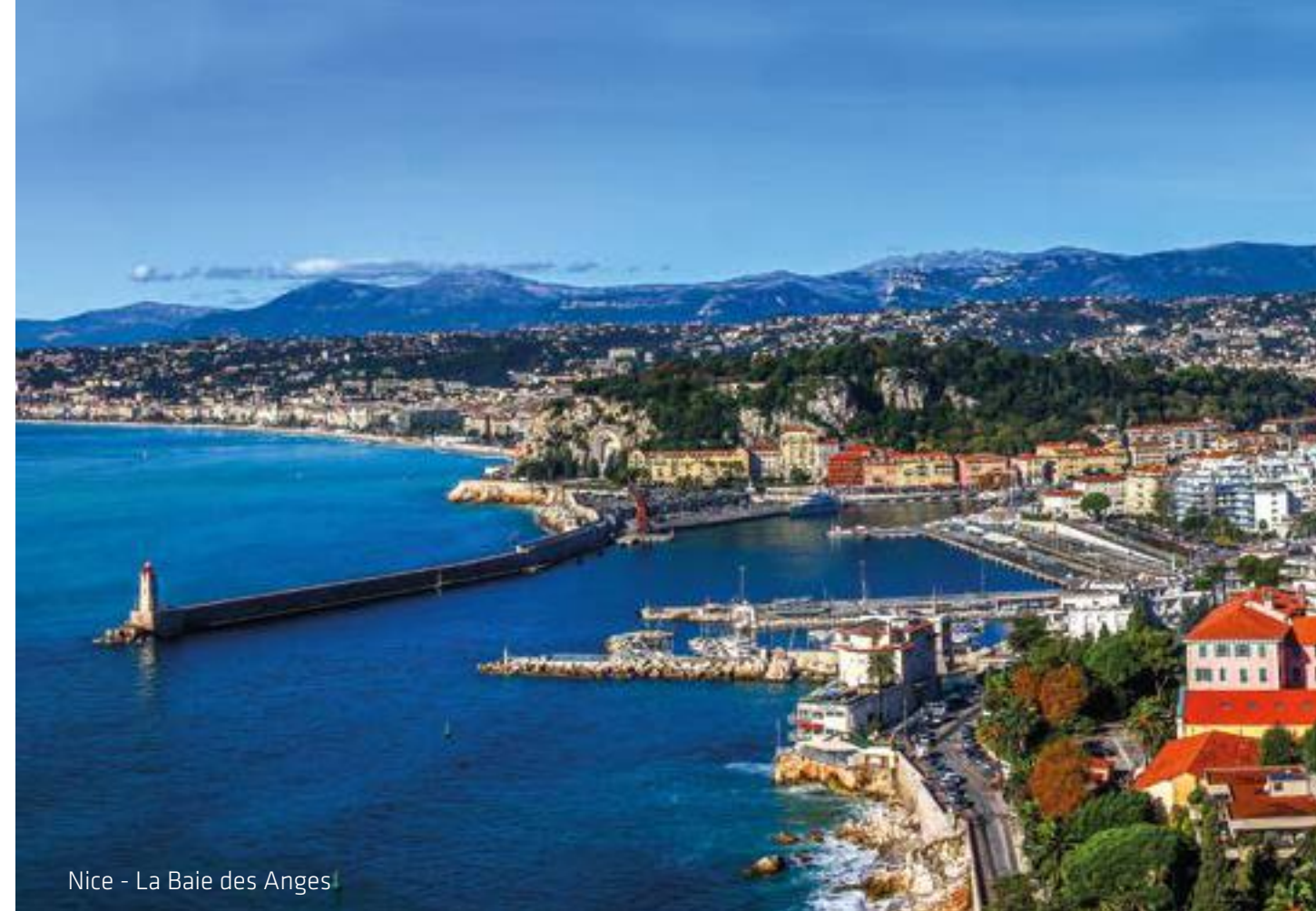
Nice - La Baie des Anges