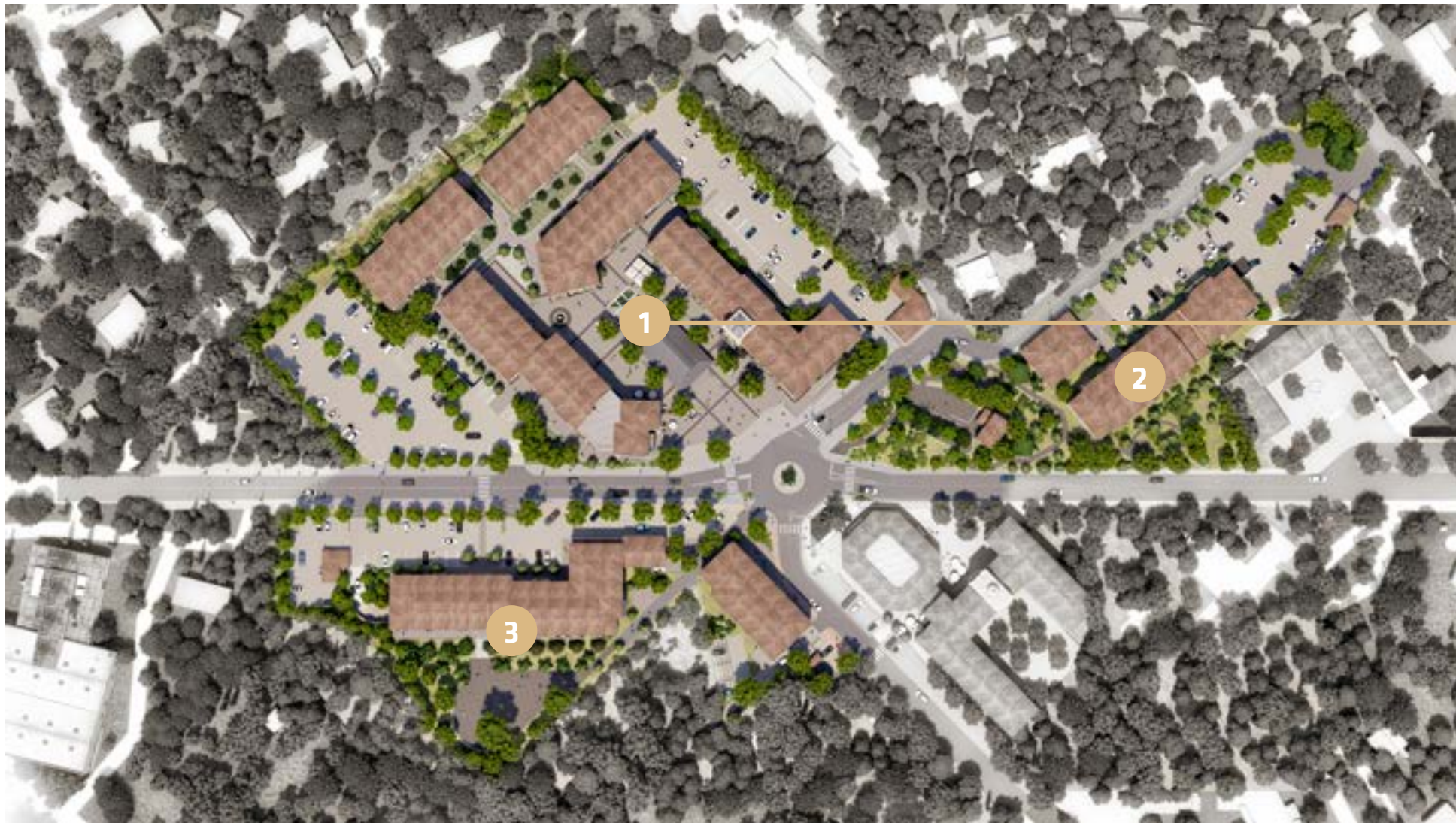
1 La Place du Village