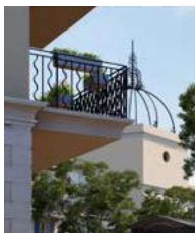
Balcons et éléments de serrurerie

Depuis toujours, la halle est un des principaux édifices publics organisant l'espace social de la cité. Anciennement en bois, nombre d'entre elles ont profité, à compter du XIX e siècle, de l'architecture du fer, accompagnant l'avènement de la civilisation industrielle, des progrès techniques et des ingénieurs-constructeurs tels que Gustave Eiffel.