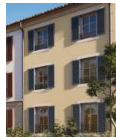
Volets battants à la « niçoise »

Il y a des millions d'années, le retrait de la mer a donné naissance à des sables ocreux et à des panoramas spectaculaires de roches déclinant toutes les couleurs du soleil. Les pigments naturels sont utilisés depuis la préhistoire, comme en témoignent pour exemple les peintures rupestres.