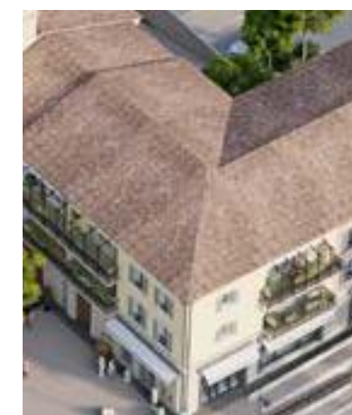
Toitures en tuiles de coloris panachés

Jusqu'au XVIII e siècle, avant la généralisation des vitrages, des panneaux en bois protégeaient les ouvertures des habitations des intrusions, de la pluie et du vent. Typiques de la région, les volets à la « niçoise » sont idéalement adaptés au climat : ils préservent du rayonnement solaire direct, tout en favorisant une ventilation naturelle et un apport de lumière en intérieur.