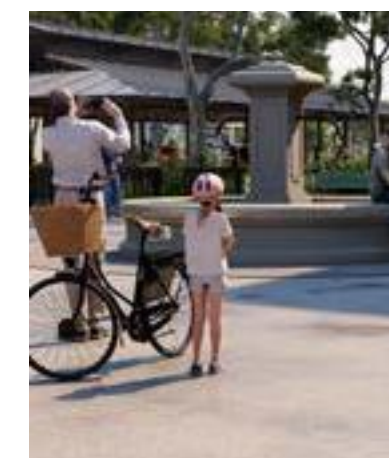
Place du village

Les toitures flamboyantes en tuiles de terre cuite font partie du paysage architectural méridional depuis des siècles. D'abord importées par les Grecs, en provenance d'Orient, elles ont ensuite été reprises par les Romains. Dès le XVII e siècle, les génoises ont été amenées par les maçons de Gênes en Provence, avant de s'étendre à tout le sud de la France.