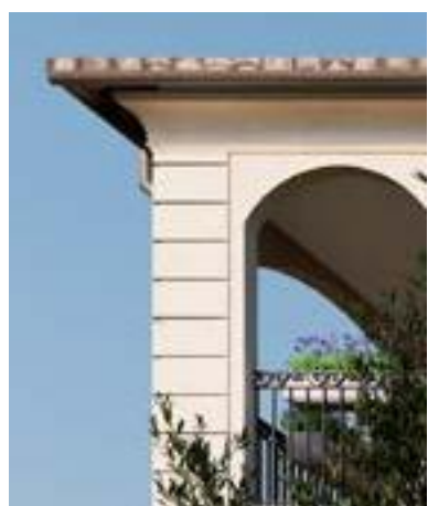
Pierre en chaînages d'angle

À l'image du campanile, rendant hommage aux anciens clochers méridionaux, les balcons ouvragés de Cœur Village reprennent également les codes de l'architecture régionale. La sobriété classique des grilles du début du XVIII e siècle a fait place au fil du temps à la fantaisie des motifs ornementaux (style rocaille, feuillages, éléments géométriques...).