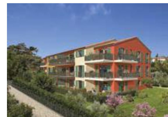
Esprit Village à Valbonne