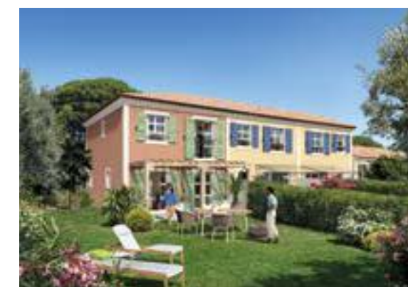
L'Orée des Pins à Roquefort-les-Pins