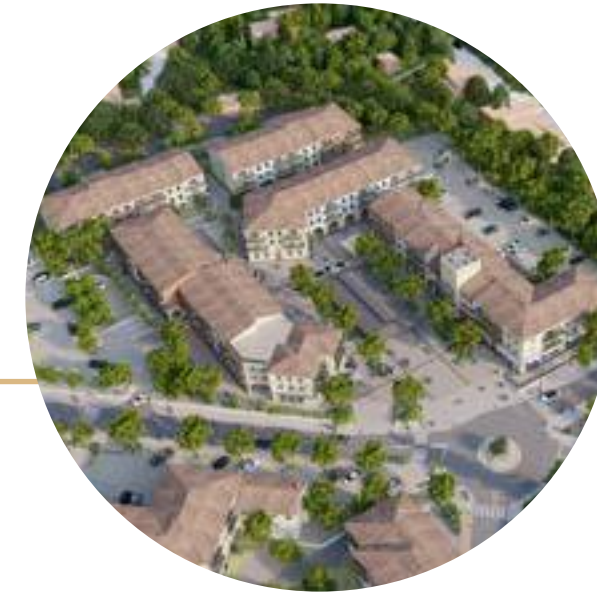
3 Le Verger