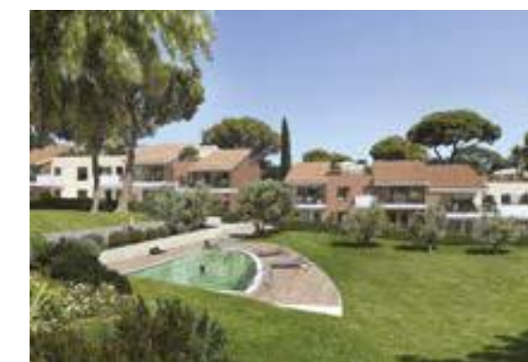
Les Jardins de la Valmasque à Mougins