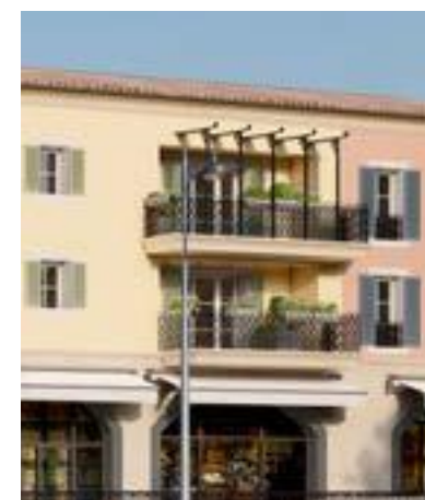
Murs revêtus d'enduits minéraux de couleurs chaudes

Présentent en Italie dès le Moyen Âge, les arcades sont devenues un élément architectural important au début du XVII e siècle et ont progressivement gagné tous les pays limitrophes. Par jours de pluie ou durant les grandes chaleurs, leurs galeries continuent à offrir un espace abrité très appréciable.