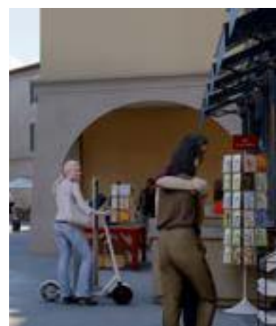
Arcades en séquences

La pierre a été utilisée de tout temps pour façonner et fortifier les encoignures des constructions à la jonction de 2 murs. Réalisés en pierre ou en parement de pierre, ces éléments fonctionnels ajoutent aujourd'hui encore aux qualités esthétiques d'une réalisation.