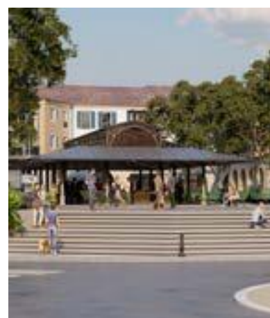
Halle de marché avec structure métallique

comme la pierre, le bois ... Des espaces publics agréables marqués par les mobilités douces et l'omniprésence du végétal... Rien de tel que du vrai pour faire du vrai ! Ce projet offre à la commune un nouveau centre de vie révélant une vraie qualité d'usages et dégageant un sentiment d'intemporalité, de sérénité.