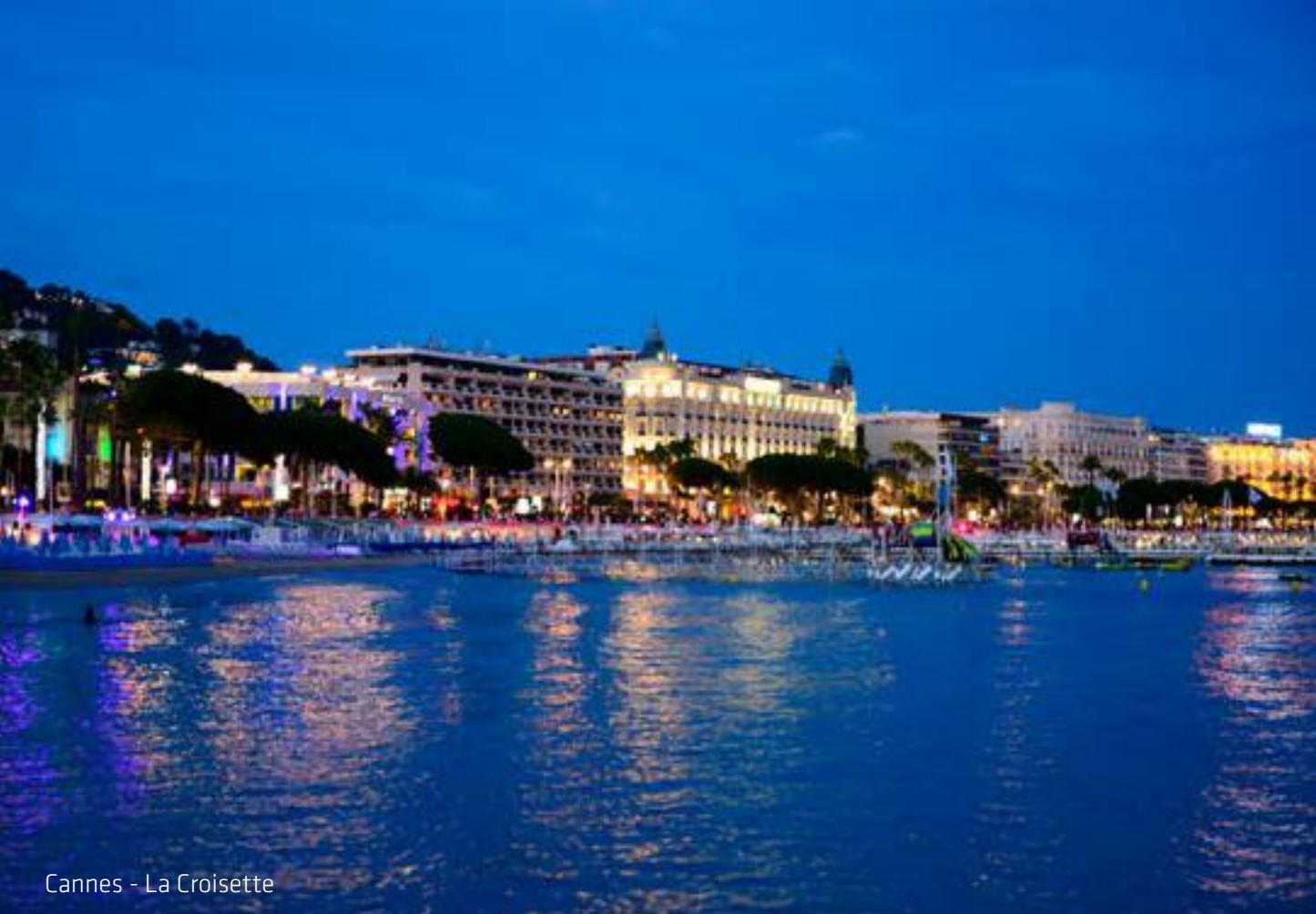
Cannes - La Croisette