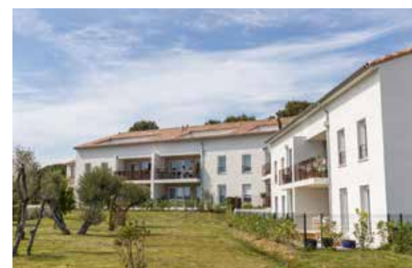
Les Jardins d'Oléa Sanary-sur-Mer