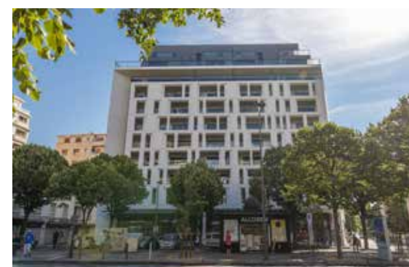
205 Prado Marseille 8 e