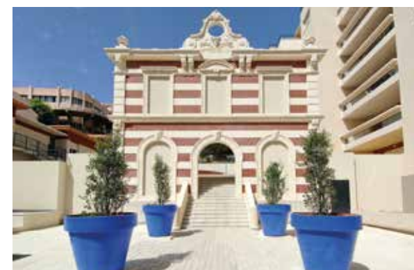
154 rue Breteuil Marseille 6 e