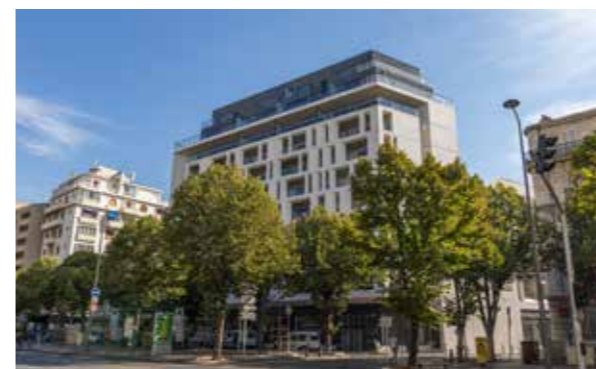
205 Prado - Marseille 8e Architecte : Emmanuel Dujardin - Tangram Architectes