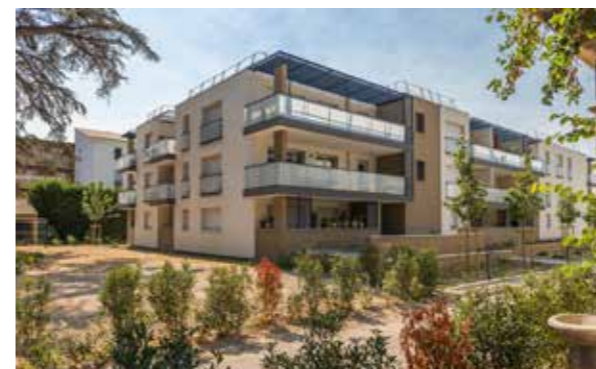
Les Terrasses du Château - Roquevaire Architecte : Agence Ordener Architecture