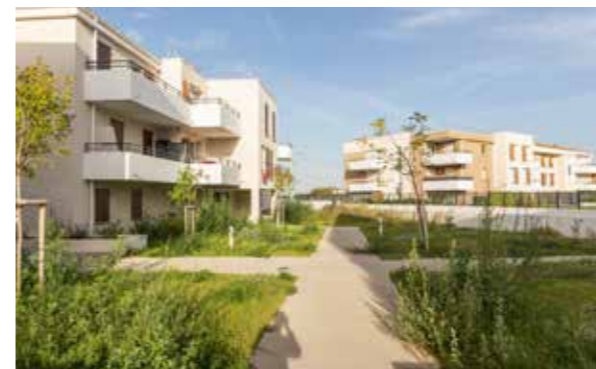
Les Jardins de l'Étang - Vitrolles Architecte : Cabinet JMD