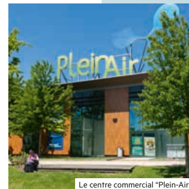
Le centre commercial "Plein-Air"