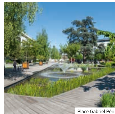
Place Gabriel Péri

Et, puisque la ville vise l'excellence, ses infrastructures culturelles et sportives sont à la hauteur de ses ambitions, avec un théâtre, un cinéma, un conservatoire, des médiathèques, un centre musical, une piscine, des gymnases, des stades, des terrains de football et de rugby, une maison des arts martiaux, un complexe sportif et un golf.