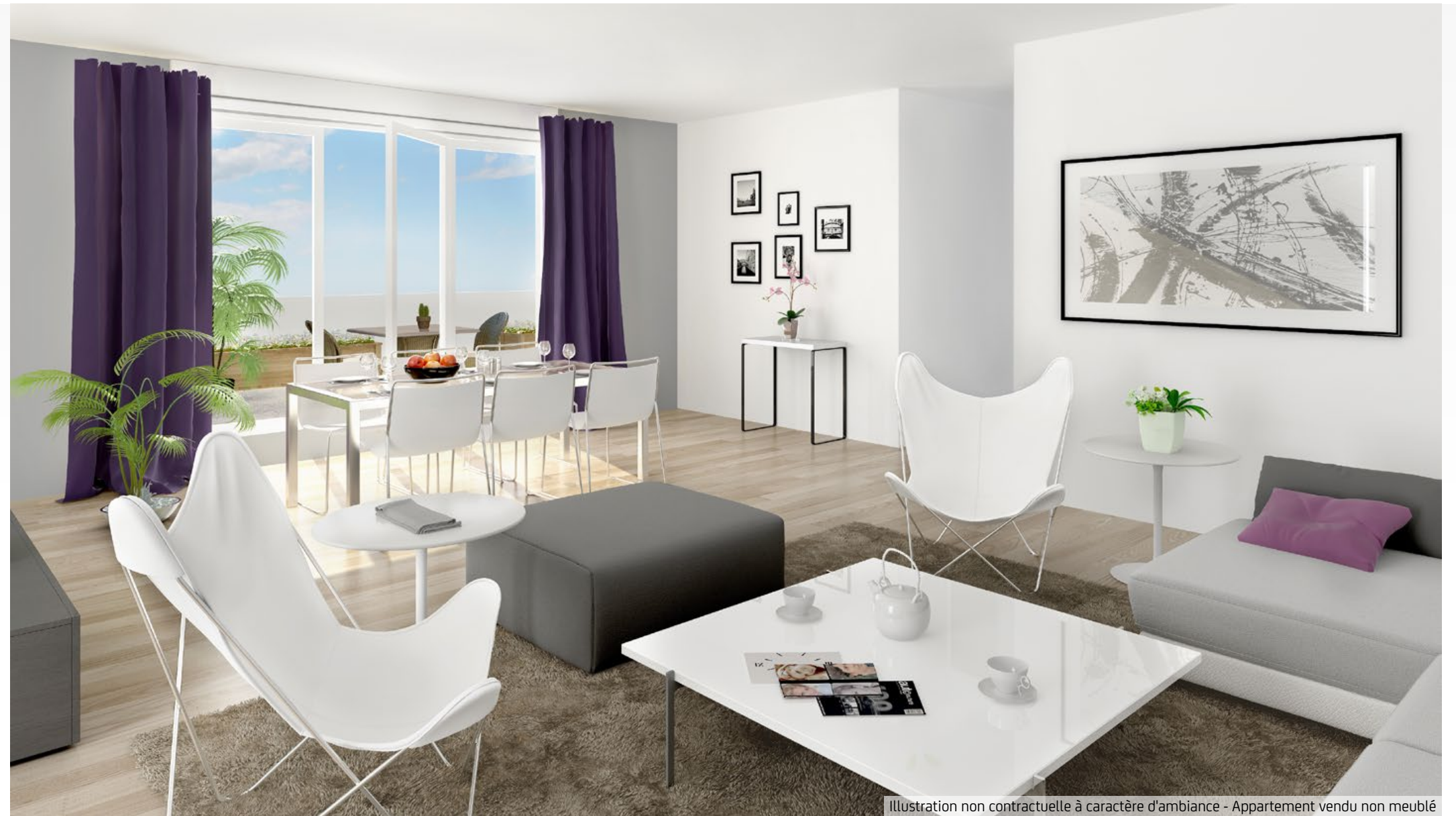
Illustration non contractuelle à caractère d'ambiance - Appartement vendu non meublé

Au dernier étage, des duplex de 4 et 5 pièces , imaginés comme de véritables maisons sur le toit, sont prolongés par des terrasses plein-ciel d'exception .