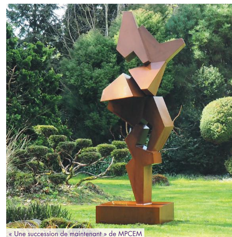
« Une succession de maintenant » de MPCEM

Cogedim s'associe avec Quai 36, première Maison de production d'art française, pour donner vie à une œuvre d'art unique et représentative de la résidence. Elle fusionne harmonieusement l'architecture d'Arboreal et son projet paysager. La réflexion artistique prise, se veut élégante et sobre grâce à un travail minutieux des matières telle que l'acier Corten. Signée MPCEM, l'œuvre d'art incarnera ainsi une identité propre et sera destinée à inspirer et à rassembler les résidents.