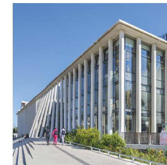
Complexe Omnisports Alain Mimoun à 11 minutes* à pied de la résidence