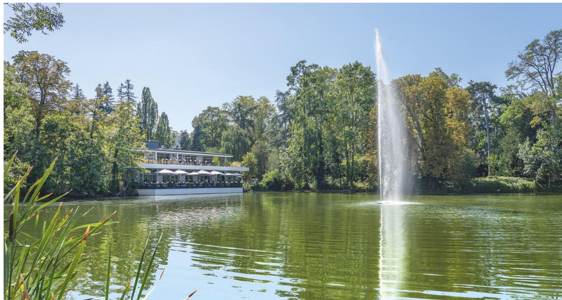
Parc du père Joseph à 5 minutes* en vélo de la résidence