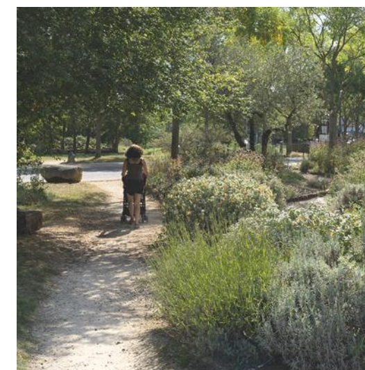
Parc Carrey de Bellemare à 4 minutes* en vélo de la résidence

À quelques pas, vous disposerez également de nombreuses infrastructures scolaires de qualité, dont le lycée Gustave Eiffel, accessible en 5 minutes*. Le parc Jacques Chirac, le stade Maurice Hubert ou encore le centre aquatique de l'Arsenal, tout proches, répondront quant à eux à toutes vos envies de sport et de détente. Enfin, à 7 minutes* en voiture, la future gare « Rueil - Suresnes Mont-Valérien », prochainement desservie par la ligne 15** du Grand Paris Express vous permettra de rejoindre La Défense en seulement 10 minutes***.