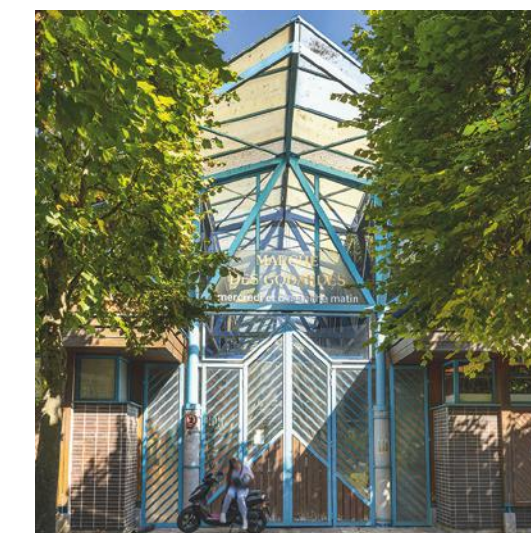
Marché des Godardes à 7 minutes* à pied de la résidence