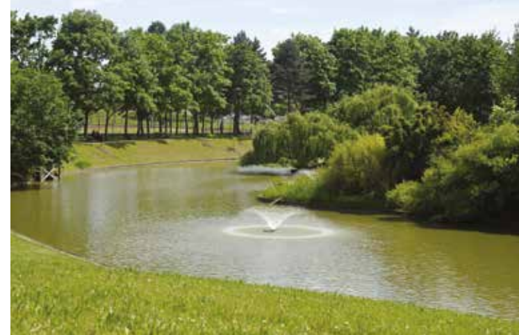
Le parc Jacques Duclos à 16 min* à pied de la résidence