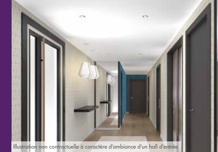
Illustration non contractuelle à caractère d'ambiance d'un hall d'entrée