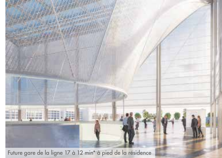
Future gare de la ligne 17 à 12 min* à pied de la résidence

Portée par l'arrivée de deux lignes du métro du Grand Paris Express*, Le Blanc-Mesnil gagne en attractivité. À seulement 7 km* de la Porte de la Vilette, cette ville de la petite couronne parisienne est en plein essor. Elle redessine son territoire avec ambition tout en conservant les charmes de son patrimoine naturel. Le cadre de vie des Blanc-Mesnilois se veut attractifs, agréable à vivre et verdoyant au quotidien.