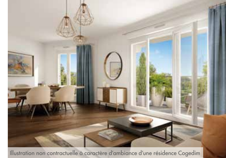
Illustration non contractuelle à caractère d'ambiance d'une résidence Cogedim