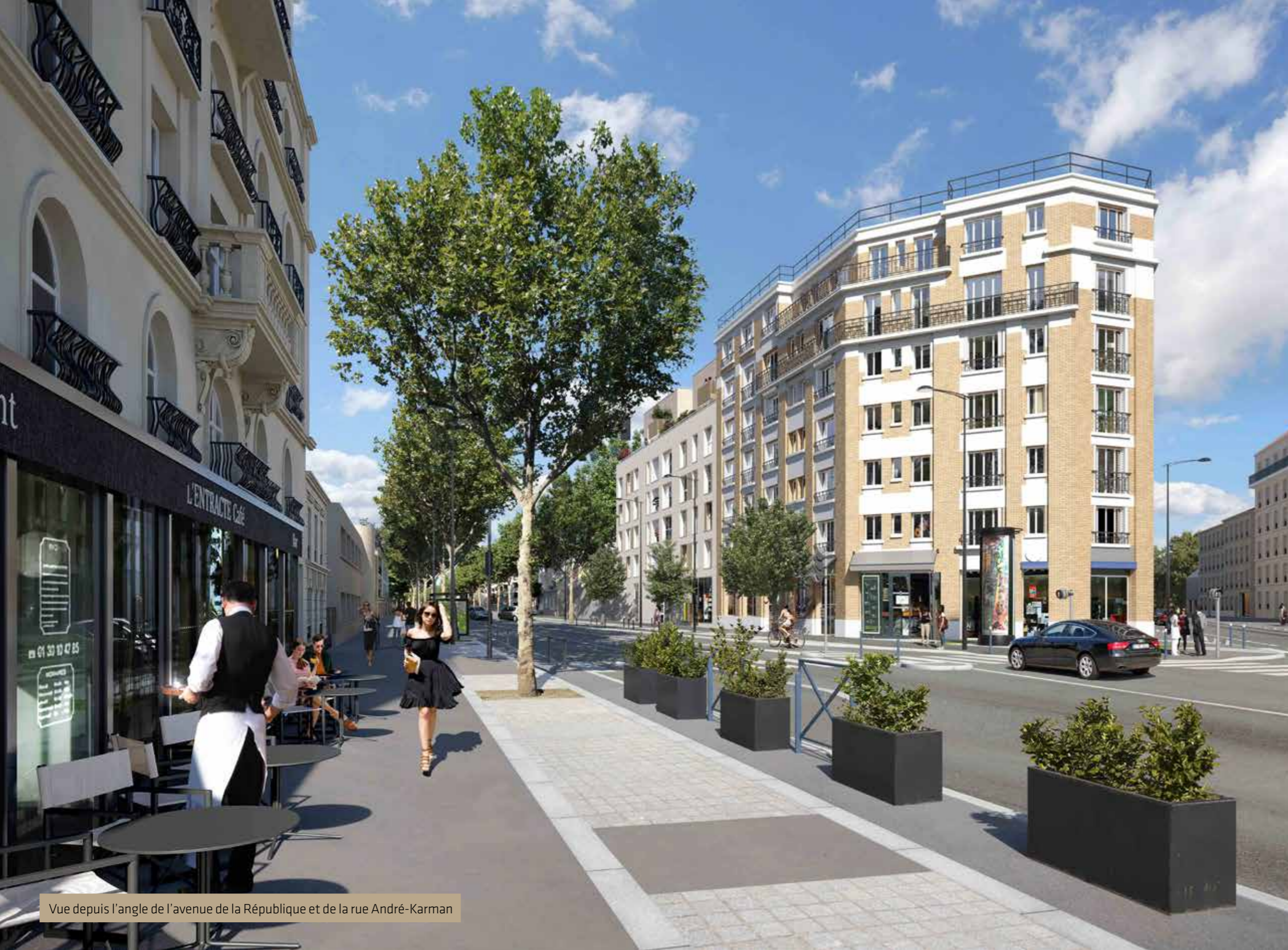
Vue depuis l'angle de l'avenue de la République et de la rue André-Karman