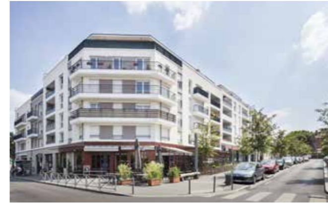
Carré Renaissance II - Noisy-le-Grand