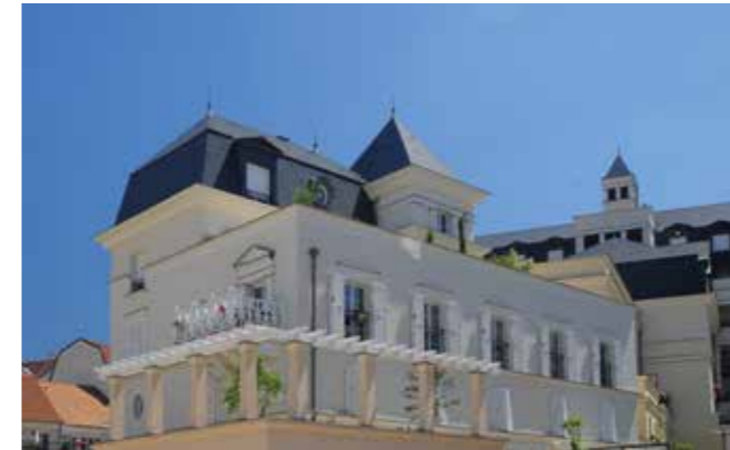
Palais Colbert - Le Plessis Robinson