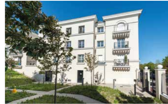
Le VI - Rueil-Malmaison