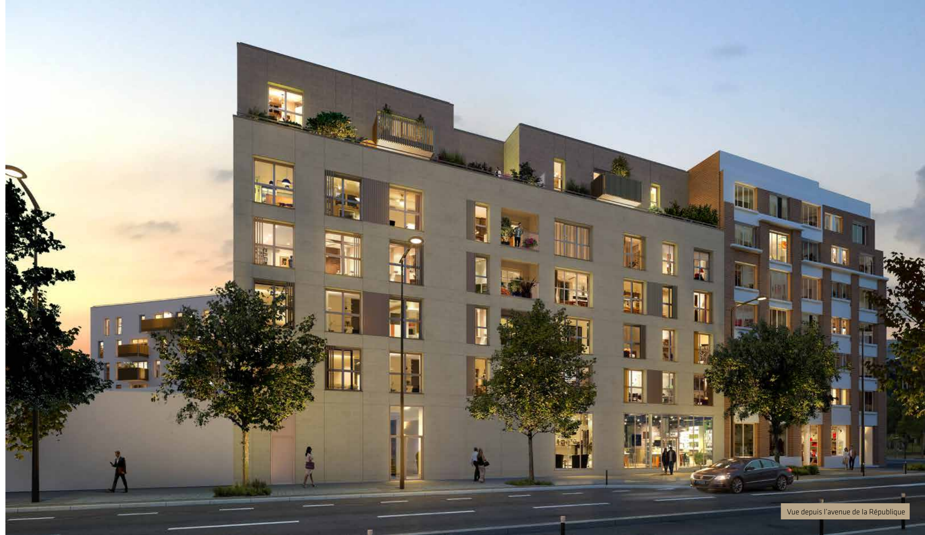
Vue depuis l'avenue de la République

Conçu par l'agence Quadri Fiore , le 54 République est un élégant projet d'inspiration contemporaine. Il s'affirme par une écriture sobre, pourvue d'éléments architecturaux soignés : parement de pierre ennoblissant les façades, généreuses surfaces vitrées attirant la lumière, baies et garde-corps ornés en touches de lames métalliques verticales couleur bois. La réalisation a été pensée au bénéfice d'une qualité de vie aussi appréciable au-dedans qu'au-dehors. Certains acquéreurs seront séduits par les loggias investissant les séquences en retrait sur chacune des deux rues ou les grandes terrasses libérées côté ciel par l'attique double hauteur. D'autres préféreront les balcons animant les façades intérieures ou les jardins privatifs du cœur d'îlot.