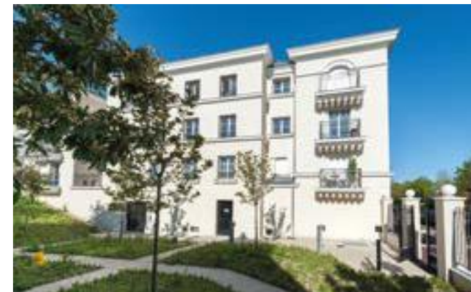
Le VI - Rueil-Malmaison