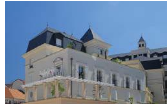
Palais Colbert - Le Plessis Robinson