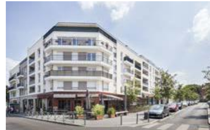
Carré Renaissance II - Bondy