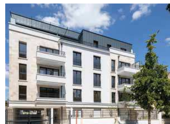
Villa Flora - Fontenay-sous-Bois Architecte : A2D Architecture