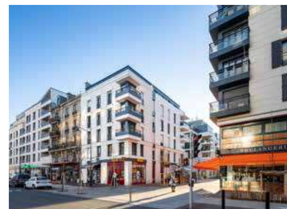
26 rue de Paris - Joinville-le-Pont Architecte : Smaïn Barkat