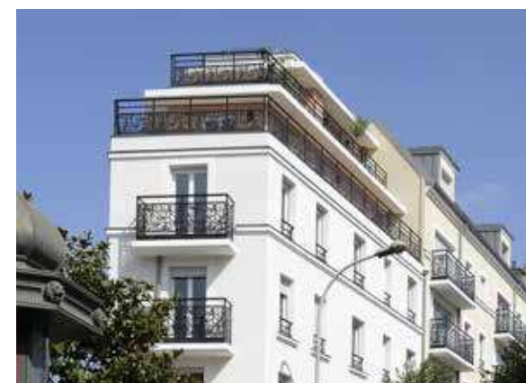
Côté Ville - Le Perreux-sur-Marne Architecte : Lionel de Segonzac