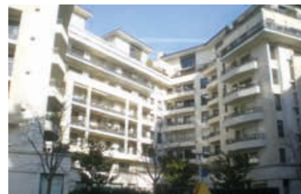
Les Allées de Seine - Issy-les-Moulineaux Architecte Cabinet Lelieur