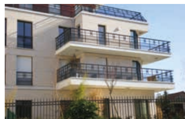
Le Jardin des Sentes - Meudon Architecte Hugues Jirou