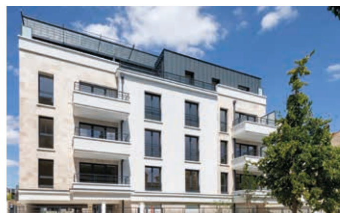
Villa Flora - Fontenay-sous-Bois Architecte : A2D Architecture