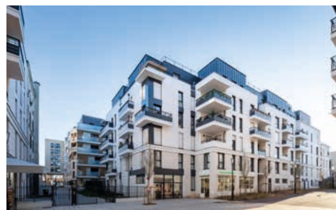
26 rue de Paris - Joinville-le-Pont Architecte : Smaïn Barkat