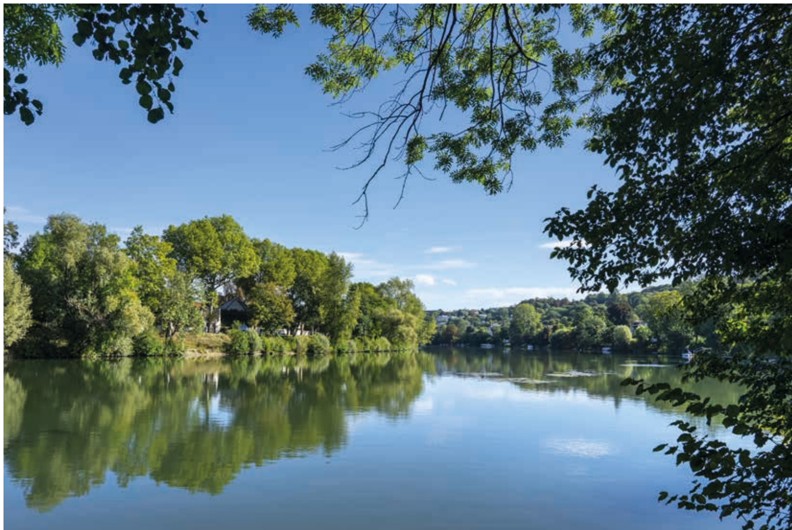
Sucey-en-Brie, une ville agréable à vivre en lisière des 3 000 ha de l'arc boisé du sud-est francilien et proche des bords de Marne