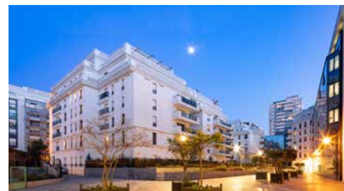
Levallois-Perret - Carré Jules Vernes Architecte : DGM & Associés