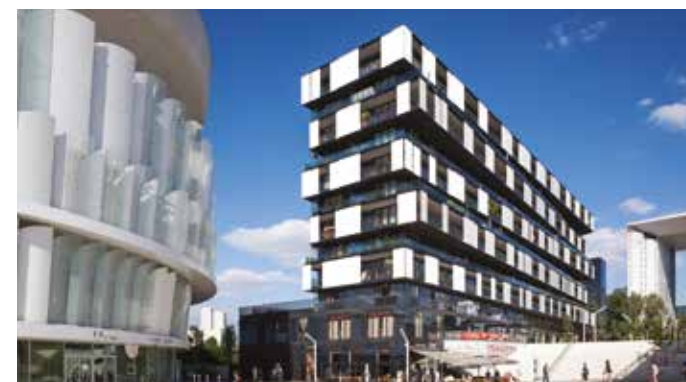
Nanterre - One Architecte : Farshid Moussavi Architecture